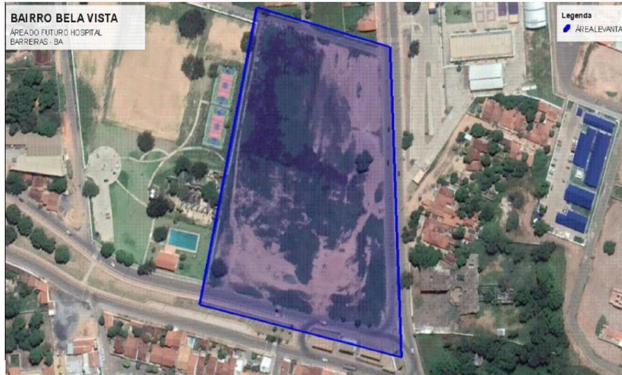
Figura 1: localização do terreno

Trata-se da elaboração de estudos preliminares, anteprojeto, projeto básico, projeto legal, projeto executivo e assistência à supervisão e fiscalização dos serviços de construção do hospital geral de Barreiras - Ba, contemplando área aproximada de 13.073,72 m 2 , distribuídos em 16 (Dezesseis) blocos, localizado na Rua das Turbinas, sn, Barreirinhas – Barreiras – BA.