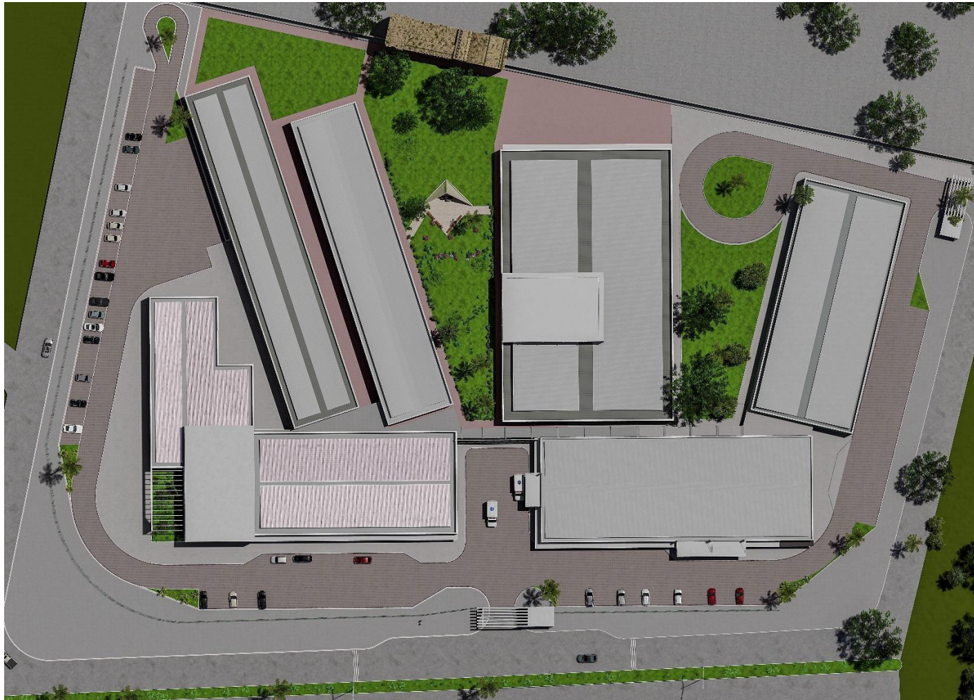
Figura 3: Vista superior da implantação