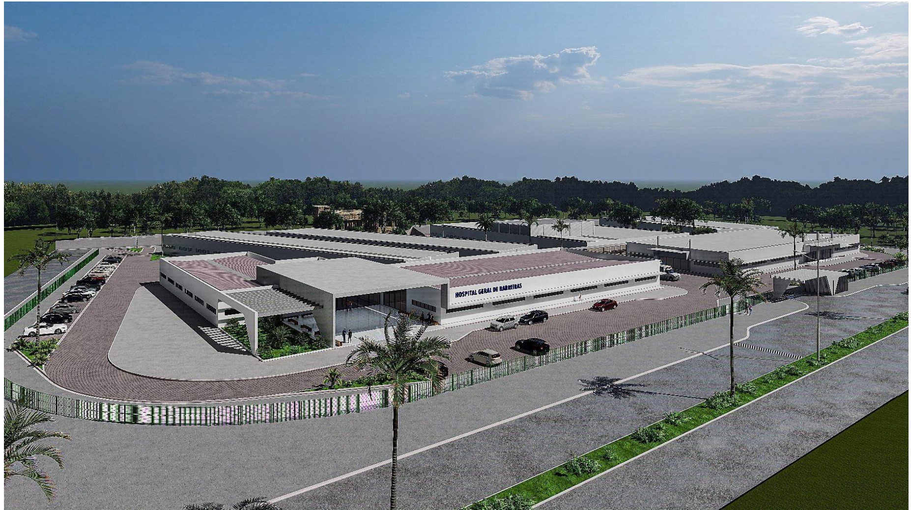
Figura 2: Visão Panorâmica do EAS