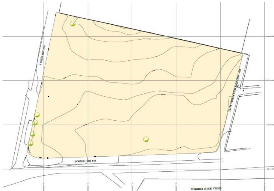
Figura 2: Levantamento Topográfico

O Hospital será localizado nas coordenadas 499760.79 m E/ 8658696.42 m S.