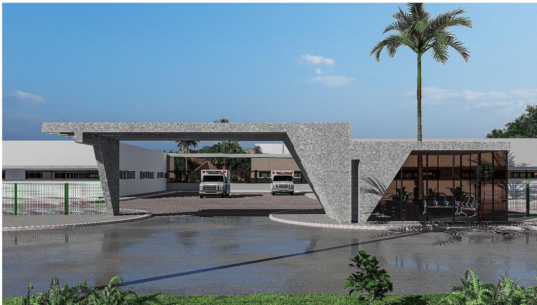
Figura 5: Guarita principal da entrada