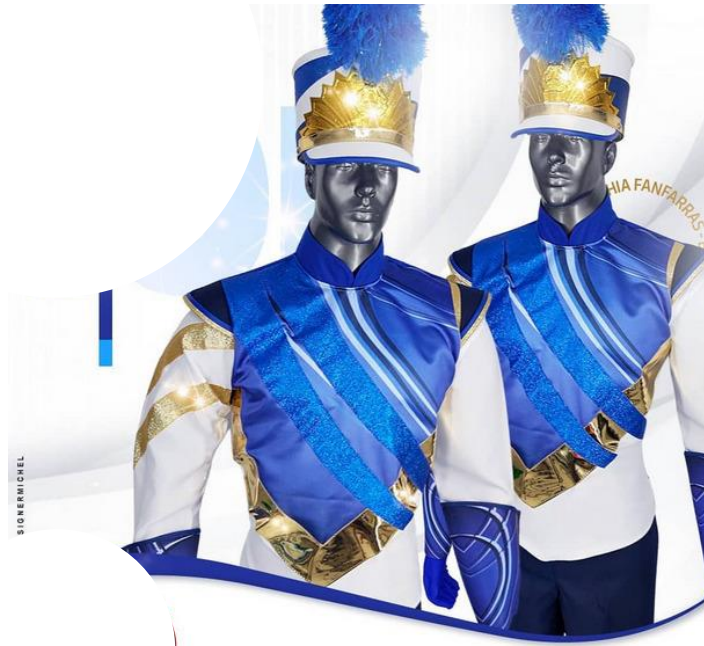
Uniforme masculino Blusa igual a foto acima e calça branca