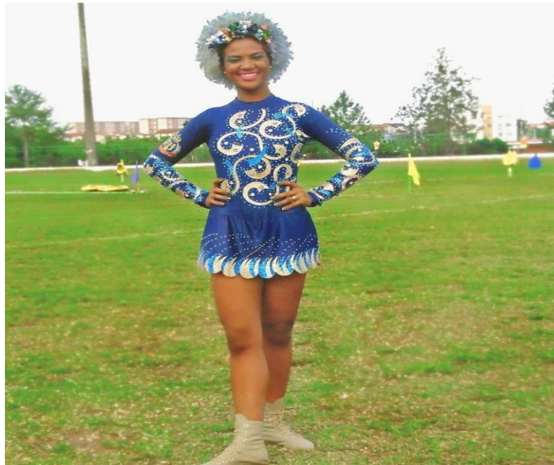
Fardamento Feminino Linha de frente Tecido o mesmo da foto